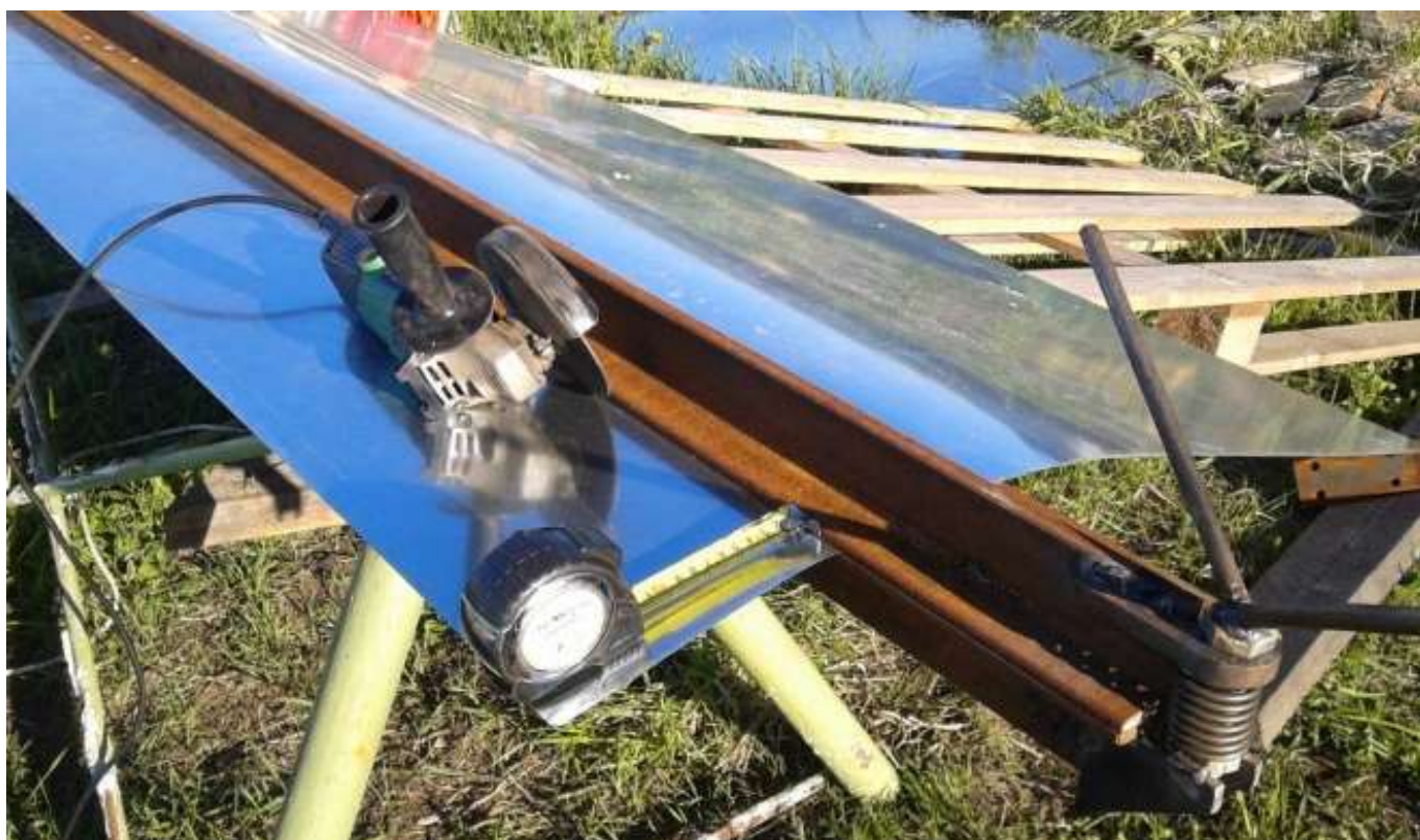
Станок Для Сгибания Жести